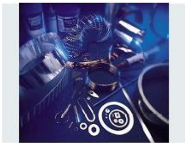
PRODUITS DE BRASAGE