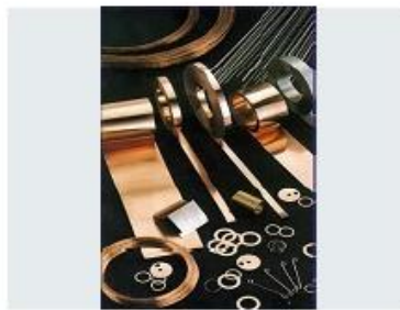
LAMINÉS ET PIÈCES DE FORME